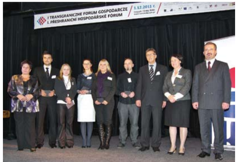
Ponad stu zaproszonych gości – samorządowców oraz przedsiębiorców z Polski i Republiki Czeskiej wzięło udział w Forum.