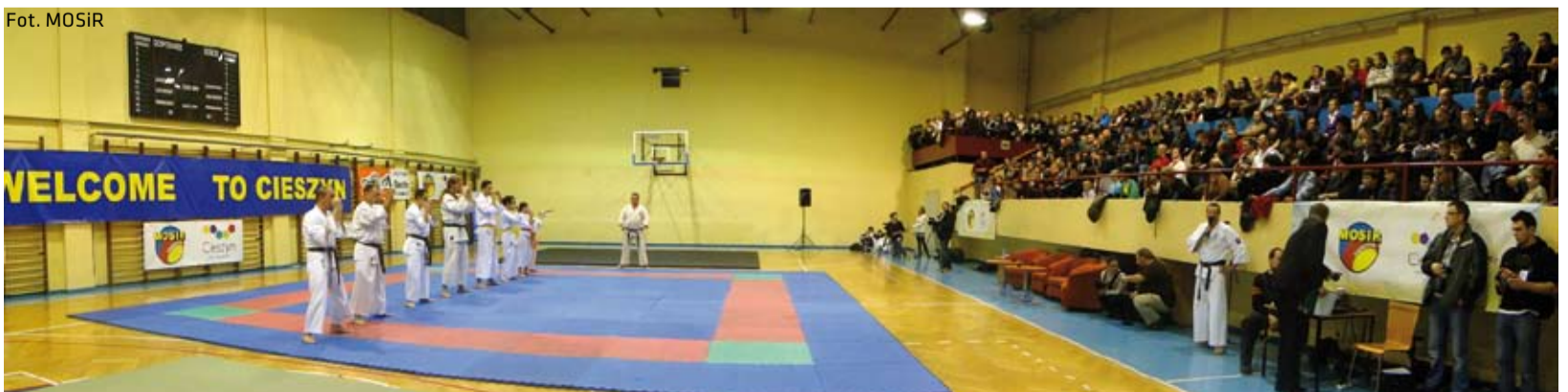
Festiwal Sztuk Walki okazał się pełnym sukcesem i zgromadził tłumy publiczności